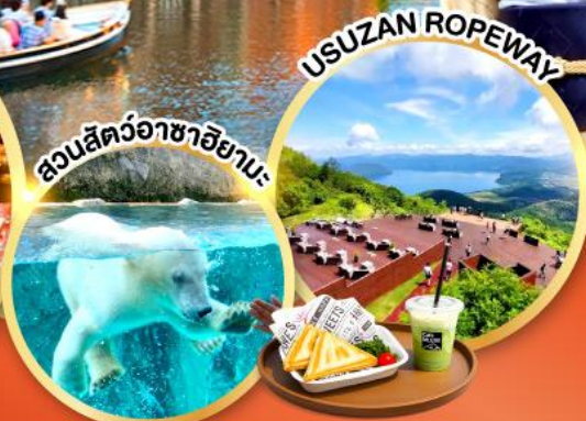
สวนสัตว์อาซาฮิยามะ