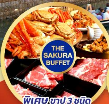
พิเศษชาบู 3 ชนิด (บุฟฟาร์:บะ+ซูโอะ+ปูชน)