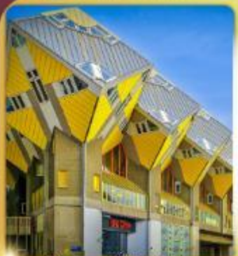
บ้านลูกเต่า โค้คคูมูส

“ล่องเรือหลังคากระจก” ชมกรุงอัมสเตอร์ดัม