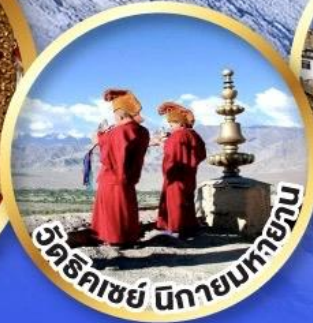
วัดธิกะชัย นิกายมหายาน