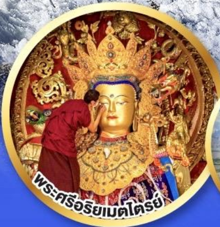
พระศรีอริยเมตไตรย์