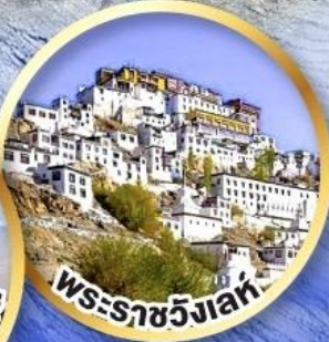
พระราชวังเลห์