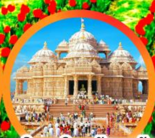
วิหารอินดูอัชมาดัม