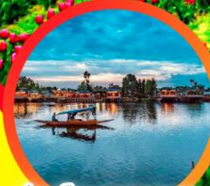
ล่องเรือทะเลสาบดาล

เทศกาลทิวลิปบาน ในอ้อมกอดหิมาล้ำ อัครา ศรีนาคา กุลมาร์ค โซนามาร์ค เดลี 6วัน 5คืน