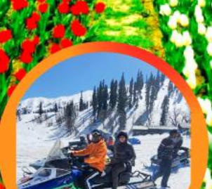
ขี่ SNOW MOBILE