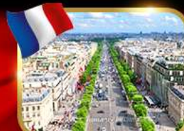
เดินเล่นย่านช็องเซลีซ