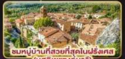
ชมหมู่บ้านที่สวยงามที่สุดในฝรั่งเศส (มูสดีเยแซงมาร์)