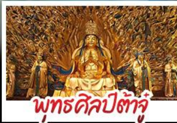
พุทธศิลป์ต้าจู๋