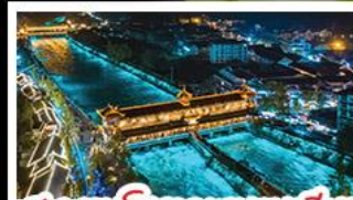
สะพานปิรามิดเทียนเหมินเฉียว