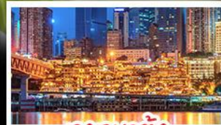
ฉางเฉาตั้ง