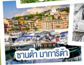
ซานต้า มารีตา