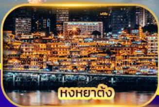
หงหยาดิง