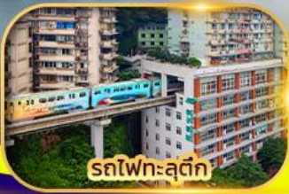
รถไฟฟ้าสุดึก