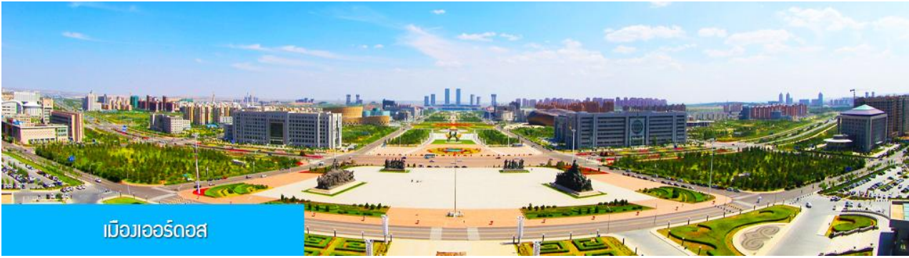
เมืองเออร์ดอส