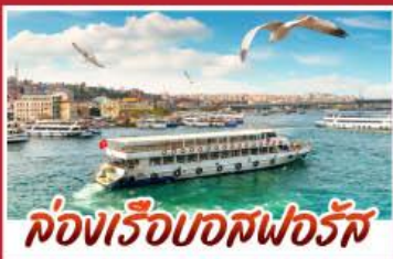
ล่องเรือบอสฟอรัส