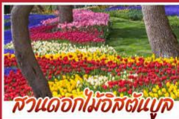
สวนดอกไม้อัสตันบูค