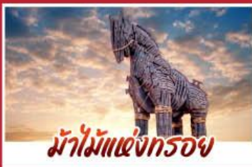
ม้าไม้แห่งกรอย