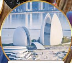
โรงแรมหรูไฮบูท