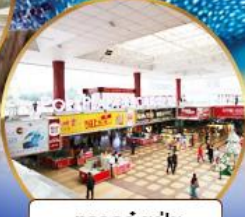
ตลาดกังเป๋