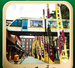
“ตงเจียวจื่อ”