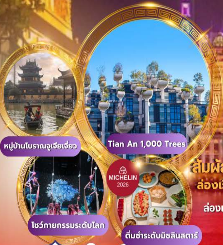
หมู่บ้านโบราณจูเจียเจี้ยว