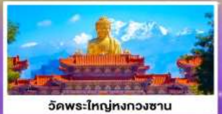
วัดพระใหญ่ทงกวงชาน