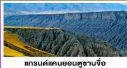
แกรนด์แคนยอนตูซานจื่อ