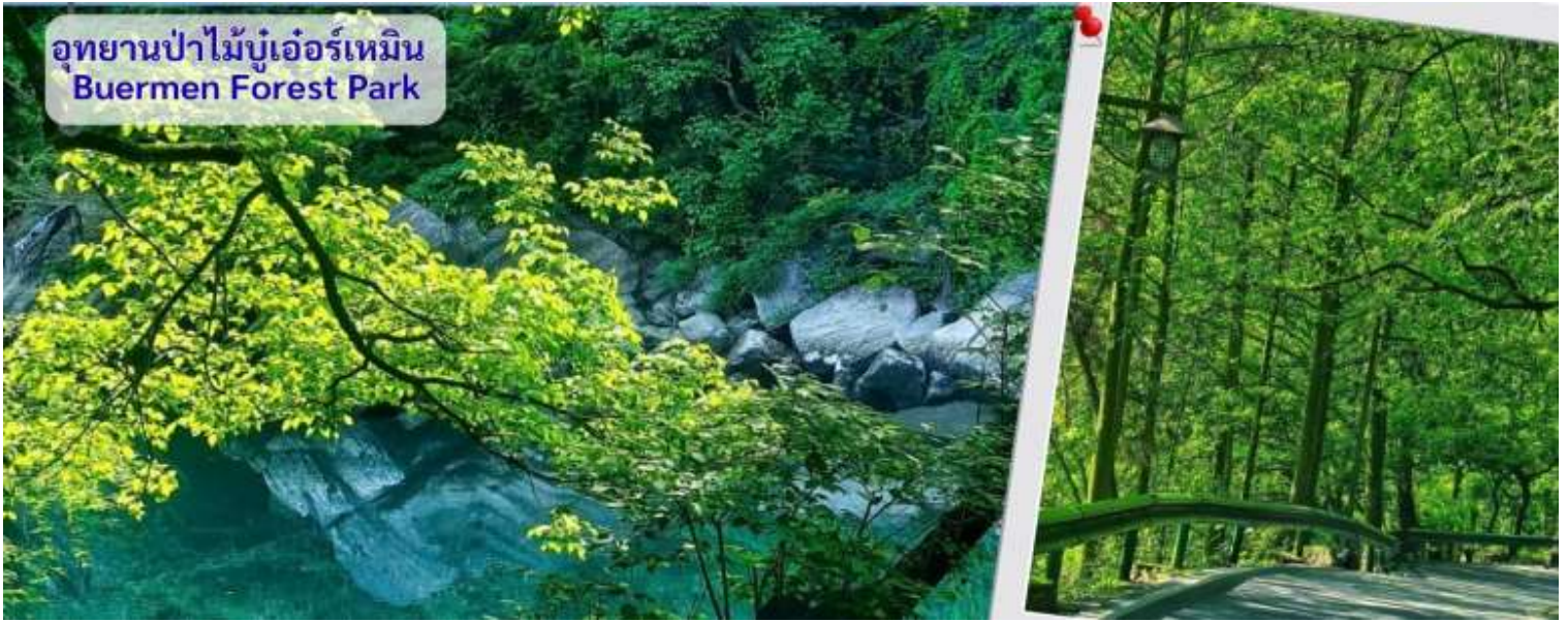
อุทยานป่าไม้บูเออร์เหมิน Buermen Forest Park

จากนั้นนำทุกท่านเดินทางสู่ น้ำพุร้อนบูเออร์เหมิน เป็นน้ำพุร้อนธรรมชาติที่มีชื่อเสียงที่สุดแห่งหนึ่งในมณฑลหูหนาน ตั้งอยู่ทางทิศใต้ของ อุทยานป่าไม้แห่งชาติบูเออร์เหมิน ในอำเภอหยงชุ่น: น้ำในบ่อน้ำพุร้อนอุดมไปด้วย แร่ธาตุสำคัญ สตรอนเชียม ซิลิเกต ซึ่งมีคุณสมบัติช่วยบำรุงผิวพรรณ ช่วยระบบไหลเวียนโลหิต และผ่อนคลายระบบประสาทส่วนกลาง อุณหภูมิน้ำพุร้อน ที่มีอุณหภูมิคงที่ประมาณ 39.8 - 41 องศาเซลเซียส ตลอดทั้งปี ซึ่งเป็นระดับที่พอเหมาะสำหรับการแช่เพื่อสุขภาพ บรรเทาอาการแช่บ่อน้ำพุร้อนตั้งอยู่ท่ามกลางทัศนียภาพที่สวยงามริมแม่น้ำเมิ่งตั้ง โดยมีทั้งบ่อกลางแจ้งที่สร้างขนานไปกับหน้าผาและซ่อนตัวอยู่ในป่าทึบ รวมถึงบ่อในร่มและบริการสปา จำนวนบ่อมีบ่อแช่กลางแจ้งให้บริการมากกว่า 29 บ่อ กระจายตัวอยู่ในพื้นที่ป่าไม้ที่อุดมสมบูรณ์ ภายในศูนย์น้ำพุร้อนมีห้องโถงต้อนรับ สถานที่อาบน้ำ ห้องอาบน้ำแบบแผ่นหิน และบ่อแช่ตัวผสมสมุนไพร (ลูกค้าต้องใส่ชุดว่ายน้ำลงเท่านั้นกรุณาเตรียมชุดว่ายน้ำไปด้วย)