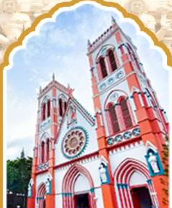
ปอนดีเชอร์