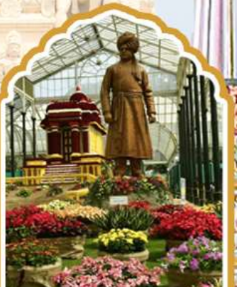
บังกาลอร์