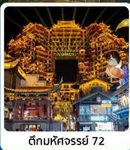
ตึกหอคจรรย 72