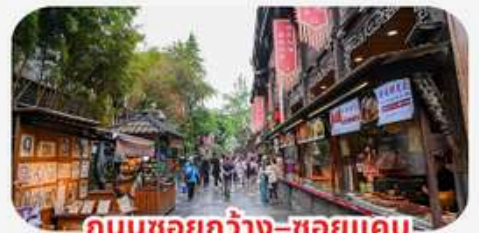
ถนนชอยกว้าง-ชอยแคบ