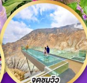
จุดชมวิวก EARTH VALLEY