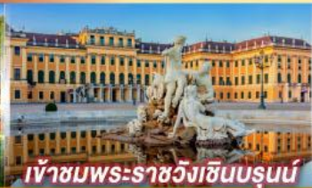
เข้าชมพระราชวังฮินบรุนน์