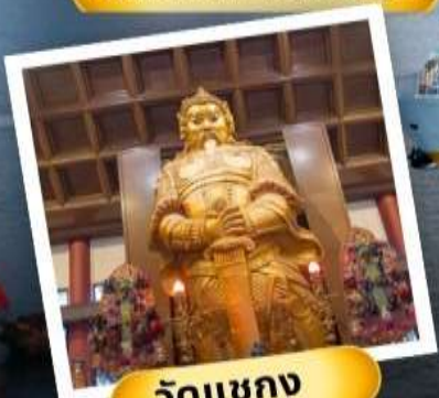
วัดเขากง