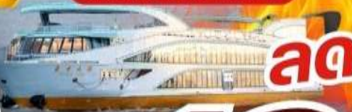
แถมฟรี! ORIENTAL PEARL CRUISE