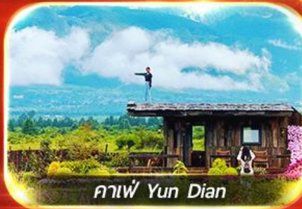
กาแฟ Yun Dian