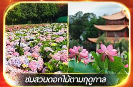
ชมสวนดอกไม้ตามฤดูกาล

นั่งกระเช้าสู่ภูเขาหิมะมังกรหยก ชมโชว์ทิเบต "Impression Lijiang" สุดอลัง เขื่อนจินคาเฟ่วิวภูเขาหิมะ, ชมดอกไม้ตามฤดูกาล