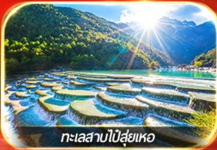
ทะเลสาบไป๋ซู่เหอ