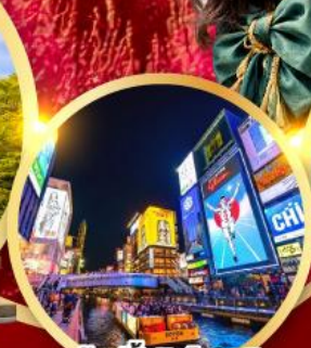
ช้อปปิ้งชินโซบาช