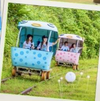
Shen'ao Rail Bike