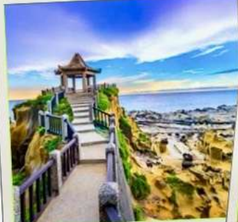
อุทยานเกาะเหอผิง