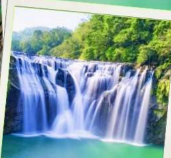
น้ำตกสีอเฟิน