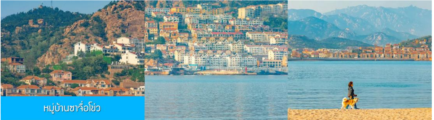
หมู่บ้านซาจื่อโข่ว

เช้า รับประทานอาหารเช้า ณ ห้องอาหารของโรงแรม (4)