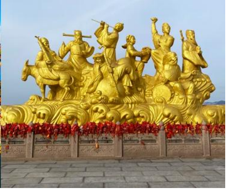
อุทยานท่งเที่ยวแปดเซียนข้ามทะเล