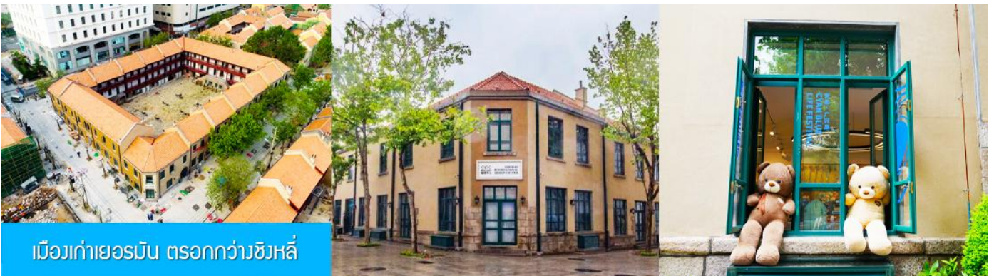
เมืองเก่าเยอรมัน ตรอกกว้างชิงหลี่