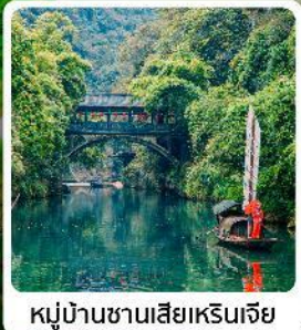
หมู่บ้านซานเสี่ยเหรินเจีย