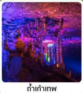
ดำเก้าทพ