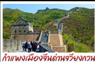
กำแพงเมืองจีนด้านจวิ้นกวน

UNIVERSAL STUDIO BEIJING DISNEYLAND SHANGHAI รถไฟความเร็วสูง - ถ่ายรูปหอไข่มุก กำแพงเมืองจีนด้านจวิ้นกวน มือพิเศษ เปิดปักกิ่ง, สุกัหม้อไฟ BUFFET