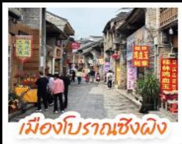
เมืองโบราณเซียงผิง

เช็คอินจุดไฮไลท์โลกกุ้ยหลิน เจดีย์เงินเจดีย์ทอง เวางวงช้าง นั่งเคเบิลคาร์สู่ เนาทรูอี้ จุดชมวิวกทะเลภูเขา ๓ แห่งเมืองหยางซั่ว ล่องเรือแม่น้ำลู่เจียง ตามรอยช้างหลังภาพรมบัตร 20 หยวน อิสระช้อปปิ้งถนนคนเดิน 2 แห่ง ถนนดงซีเซียง ถนนซีเจีย นั่งกระเช้าบอลลูนชมวิวแบบ 360 องศา