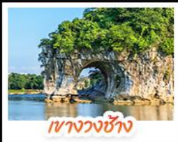
เขางวงช้าง