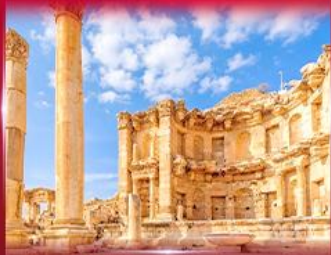
เมืองโบราณเพตรา