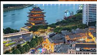
ถนนคนเดินสามตรอกสองซอย