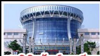
พิพิธภัณฑ์ทิวาสี

สวนสนุก FANTASYLAND - หมู่บ้านสไตล์ยุโรป พิพิธภัณฑ์ทิวาสี - ถนนคนเดินสามตรอกสองซอย ท่าเรือกิ่งจื่อ - ศาลเจ้าแม่กวนอิมพันกร เมนูพิเศษ อาหารทิวาสี, สุกีชาบูหม่าล่า