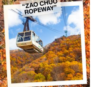
"ZAO CHU ROPEWAY"

วันเดินทาง 30 ต.ค. - 5 พ.ย. 2569 4 - 10 พ.ย. 2569