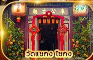
วัดเขกง ไชกง