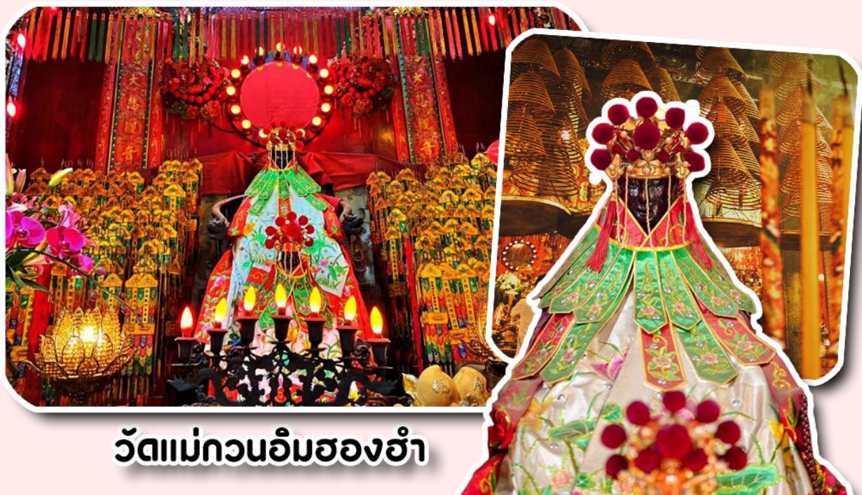
วัดแม่กวนอิมฮองฮำ

พาท่านเดินทางไปไหว้ขอพรขอเงิน วัดแม่กวนอิมฮองฮำ วัดเก่าแก่ของฮ่องกงสร้างตั้งแต่ปี ค.ศ. 1873 เป็นวัดขนาดเล็กที่มีชาวฮ่องกงศรัทธาหนักถือกันเป็นอย่างมาก วัดแห่งนี้เป็นที่ประดิษฐาน องค์เจ้าแม่กวนอิมฮองฮำ ที่มีชื่อเสียงเรื่องการให้กู้ยืมเงิน เชื่อกันว่าท่านช่วยพลิกฟื้นเศรษฐกิจของชาวฮ่องกง ผู้คนจึงนิยมมายืมเงินทำธุรกิจจนสำเร็จร่ำรวย รุ่งเรือง โดยให้ท่านอธิษฐานขอพรต่อหน้าเจ้าแม่กวนอิมฮองฮำ พร้อมกับระบุวันเวลาในการขอพรด้วย จากนั้นนำธนบัตรตามฐานะและศรัทธาที่เราจะนำเป็นสื่อในการขอพร เขียนจำนวนเงินที่ต้องการลงไปด้วย ใส่สกุลเงินยี่งดีใหญ่ แล้วนำเงินใส่ในซองแดง ควรเตรียมซองแดงไปเอง นำซองแดงไปวนรอบกระถางรูป วนขวาจำนวน 3 ครั้ง แล้วเก็บซองแดงในกระเป๋าสตางค์ เป็นเงินขวัญถุง ถ้าประสบความสำเร็จตามที่มุ่งหวังให้นำเงินในซองแดงทำบุญหยอดตู้ที่วัดแห่งนี้ในโอกาสต่อไป วิธีไหว้ให้ปัง ให้ได้โชคลาภเงินทอง ต้องไปกับเราเท่านั้น