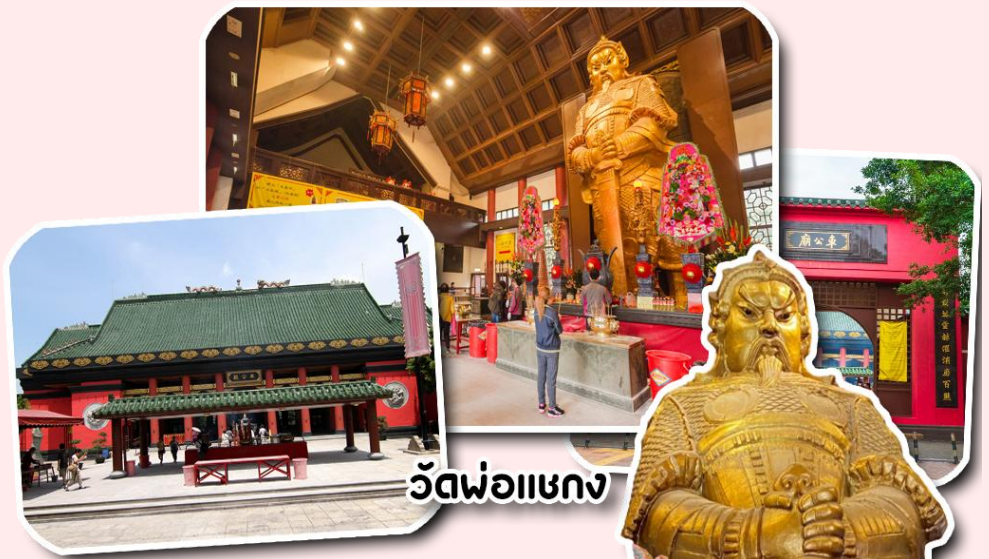
วัดพ่อแชกง