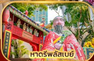
หาดร์พลัสเบย์