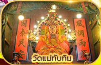
วัดแม่ทับทิม