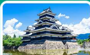
ปราสาทมัตสึโมโด้