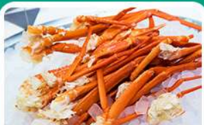
พิเศษ! บุฟเฟ่ต์ขาปู