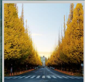
“ICHONAMIKI GINGO AVENUE”