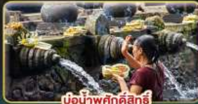
บ่อน้ำพุศักดิ์สิทธิ์