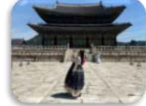
พระราชวังเคียงบก