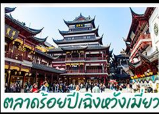
ตลาดร้อยปีเฉิงหวงเมี้ยว