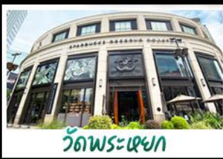
วัดพระหยก