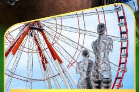
อนุสาวรีย์อาลีและนีโน่