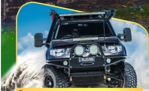
คันรถ 4WD สู้อีกกลางเทือกเขาคอเคซัส