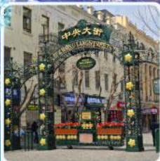
ถนนจงยาง