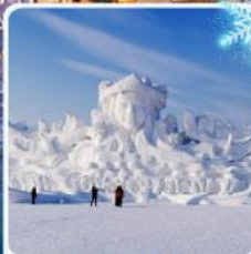
งานแกะสลัก เกาะพระอาทิตย์