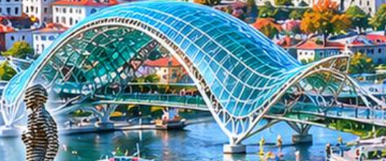
BRIDGE OF PEACE สะพานสันติภาพ