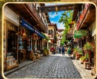
เดินเล่นย่านเมืองเก่า บรรยากาศย้อนยุค