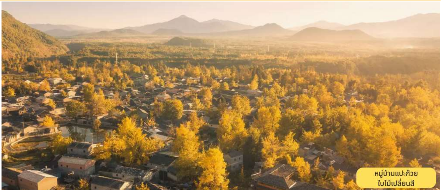
หมู่บ้านแปะก๊วย ใบไม้เปลี่ยนสี

อุทยานน้ำพุร้อน (รวมรถราง) - อุทยานทุ่งหญ้าลอยน้ำไป๋ไห่ (รวมรถราง) - หมู่บ้านแปะก๊วยชมใบไม้เปลี่ยนสี - เมืองโบราณหะซุ่น