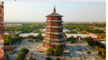
วัดเจดีย์ไม้ มู่ต้า

*ทางบริษัทฯ ขอสงวนสิทธิ์ในการสลับโปรแกรมทัวร์ตามความเหมาะสมขึ้นอยู่กับสถานการณ์หน้างาน โดยคำนึงถึงผลประโยชน์ของลูกค้าเป็นสำคัญ