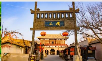
เมืองโบราณตุนหวง