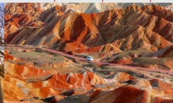
ภูเขาสายรุ้งจางเย่ต้นเสี่ย