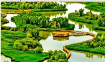
อุทยานพื้นที่ชุ่มน้ำจางเย่