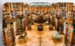
หอสมุดมรดกโลก St.Gallen