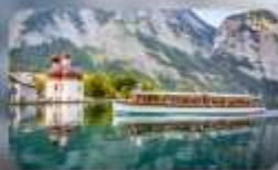
ทะเลสาบโคนิกซ์