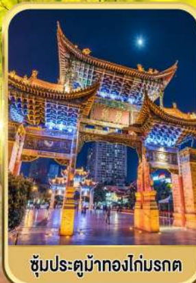
ซุ้มประตูม้าทองไถ่มรดก