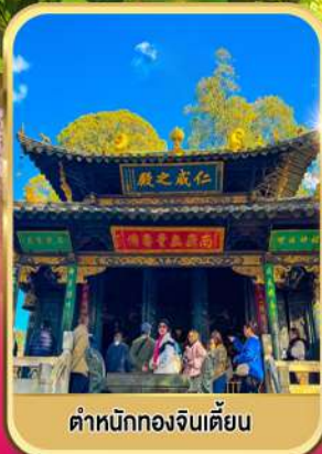
ตำหนักทองจินเตียน