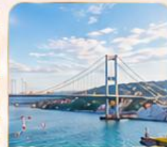
BOSPHORUS STRAIT ช่องแคบบอสฟอรัส