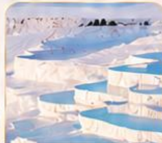
PAMUKKALE ปานุกคาล่า