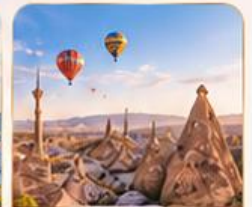
CAPPADOCIA คัปปาโดเกีย

บริการเหนือระดับ • เช็किनสะดวก • บริการช่วยเหลือ ใ้ใจทุกขั้นตอน