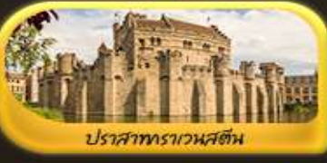
ปราสาทราเวนสตัน