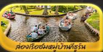
คลองเรือชมหมู่บ้านกังหัน